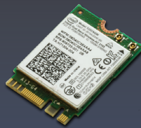
WiFi Bluetooth Verbindung M.2 Intel® AC-9260 WiFi Kit (802.11ac, bluetooth 5.0)