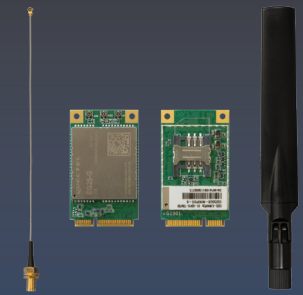
LTE Verbindung mPCIe Quectel 4G LTE CAT4 Global module EG-25G